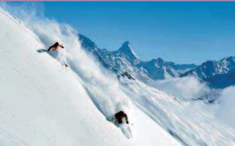
Sporthotel Lo Stambecco***